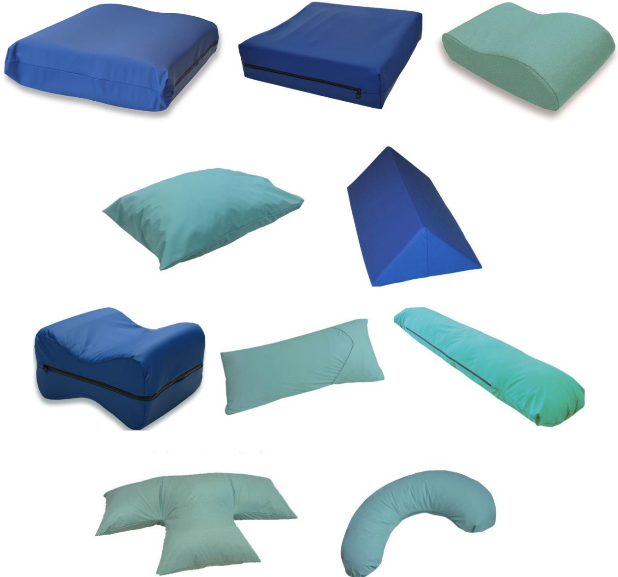
Kuva 1: Vasemmalta ylhäältä lukien; CaseSlow, CaseSupport, CaseTop, CaseClinic, MegaRay, MegaX, Mega7040, Mega18040, MegaT, MegaQ.

Jos toimitus on vahingoittunut tai puutteellinen, älä ota tuotetta käyttöön. Ota välittömästi yhteyttä tuotteen jälleenmyyjään.