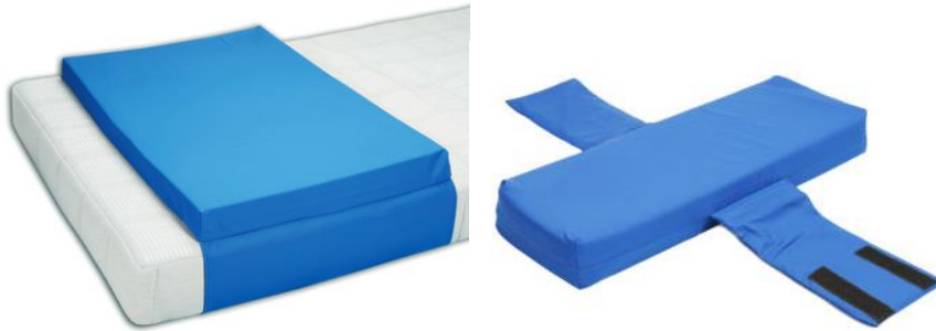
Uppifrån vänster: MegaMemorest, MegaRestabil. Bilderna är inte skalnliga.

Om leveransen är skadad eller ofullständig, ska du inte ta produkten i bruk. Kontakta återförsäljaren av produkten omedelbart.