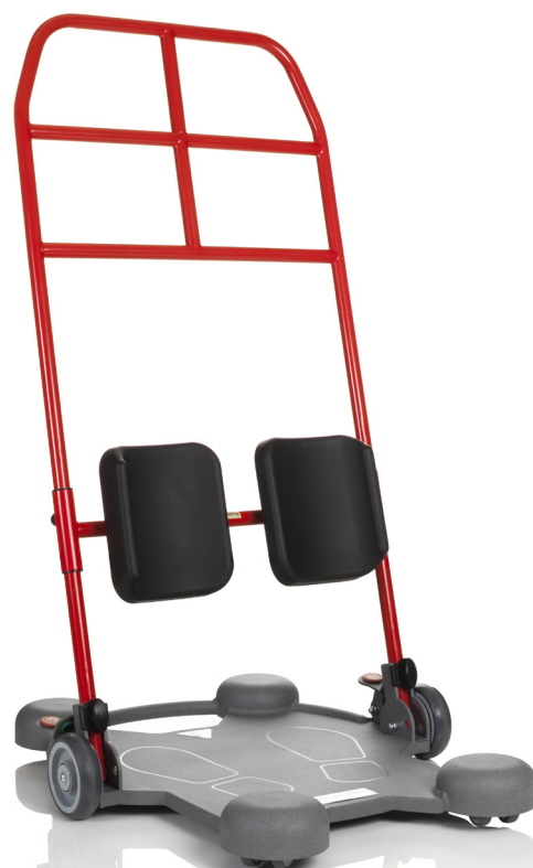
ReTurn7600 är utvecklad för större och tyngre brukare som väger upp till 205 kg.