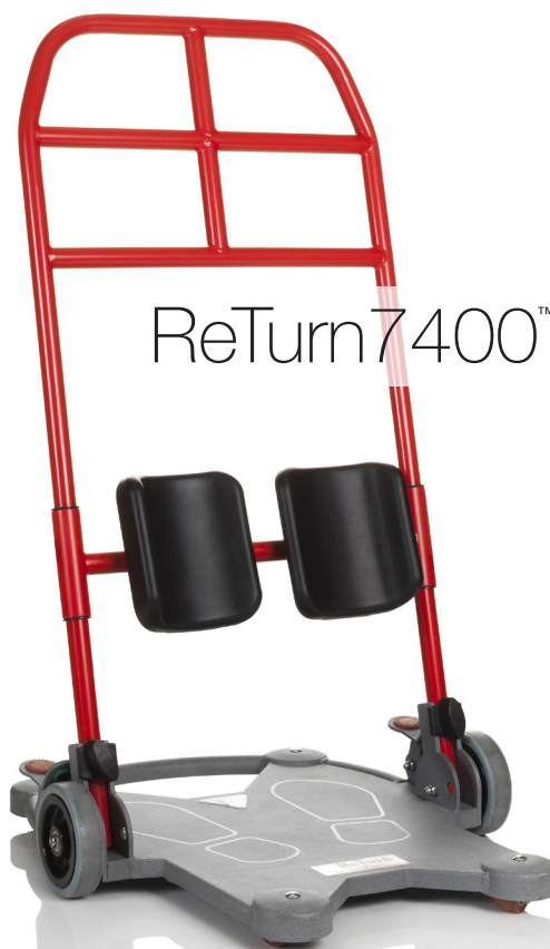
Art. nr. 7400, ReTurn7400