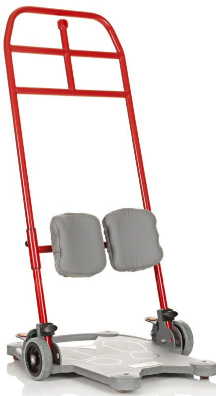
ReTurn7500i passar de flesta vuxna brukare.

ReTurn7500i är alltså originalet och succéprodukten som snart är en klassiker. För att skapa lösningar för fler situationer och för att samtidigt möta behoven hos fler typer av brukare har vi utvecklat ytterligare några modeller av ReTurn. Vi har också vidareutvecklat ReTurn7500i. Den grundläggande tanken bakom ReTurn är däremot fortfarande densamma; att brukarens egen kraft ska tillvaratas och stärkas. Alla modeller av ReTurn har därför ett par viktiga saker gemensamt: de bidrar till aktivering av brukaren och stimulerar brukaren att använda ett naturligt rörelsemönster. De ger också brukaren möjlighet att regelbundet få resa sig upp i stående ställning. Livskvalitet kan ju ibland vara så enkelt som att få utnyttja sin egen kraft och förmåga!