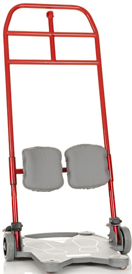
Art. nr. 7500i, ReTurn7500i , extra polstring för underbensstöden ingår som standard