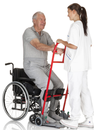
En medhjälpare ska under hela uppresningsproceduren ha en fot på bottenplattan för att ge motvikt

ReTurn är ett enkelt och säkert stöd för aktiv uppresning. Uppresningsstegen på ReTurn7500i/7400/7600, lutar framåt, i riktning bort från brukaren. Denna konstruktion ger brukaren gott om utrymme och möjlighet att komma tillräckligt nära för att resa sig till stående genom att använda sin egen kraft och ett naturligt rörelsemönster.