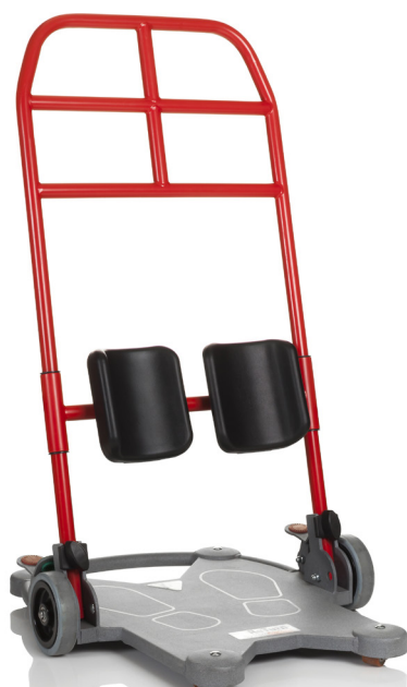
ReTurn7400 passar för kortare vuxna och för barn.