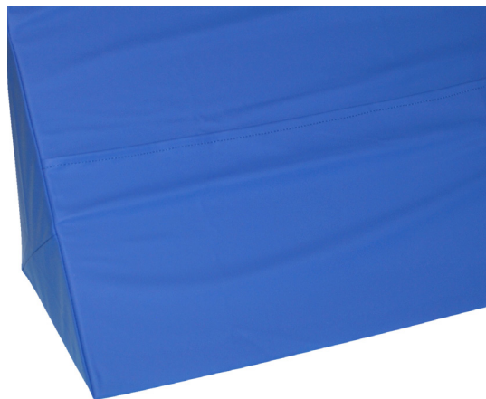
Kuva 1. Mega™Ray-tyynyn läppäkiinnitys

Hygieniapäällisen materiaali on joustavaa, neste- 3 , lika- ja eritetiivistä 4 PU-laminoitua polyesteria. Materiaalilla on korkea hankaus- ja kulutuskestävyys 5 . Päällisen materiaaliin on integroitu bakteeri-, home- ja sienisuojaus 6 . Päällisessä ei ole vetoketjua. Tukityynyn pohjasta löytyy kuvan 1. mukainen läppäkiinnitys.